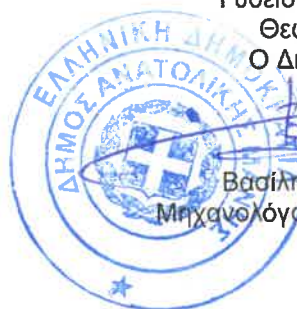
Βασίλης Βερούτης Μηχανολόγος Μηχανικός ΠΕ